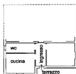
PIANTA PIANO TERRA h 3,00 mt