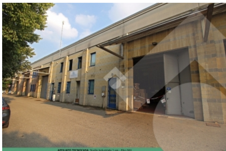
AFFILIATO TECNOCASA Studio Industriale 1 sas - Rho (MI)